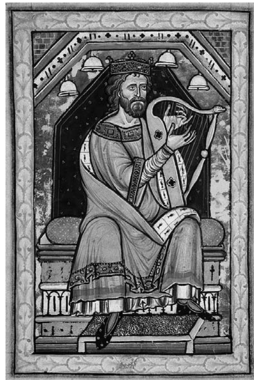
König David spielt Harfe, Westminster Psalter, British Library